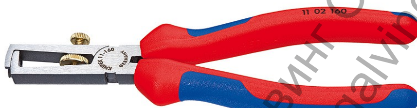
11 02 160 Полирана глава, двукомпонентни ръкохватки