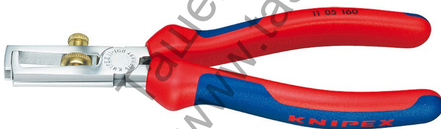
11 05 160 Хромирана челюст, двукомпонентни ръкохватки