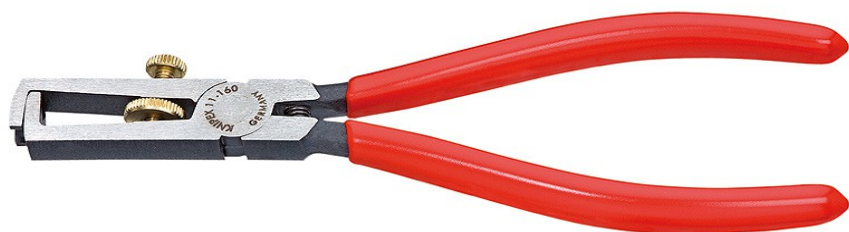
11 01 160 Полирана глава, еднокомпонентни ръкохватки